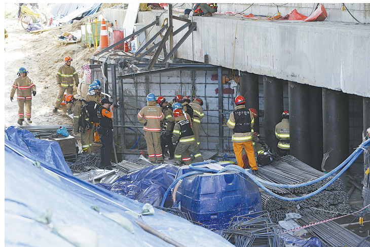
6月1日，在韩国京畿道南杨州市，救援人员在发生事故的地铁施工现场救援。