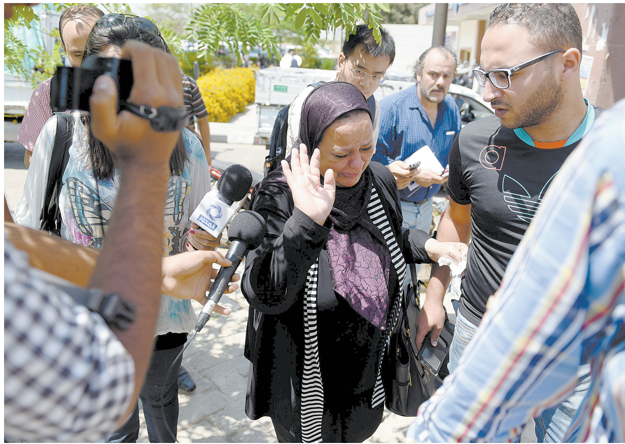
五月十九日,在埃及开罗,媒体记者采访机上人员家属。

新华社北京5月19日电 综合新华社驻开罗、巴黎记者报道:一架从法国巴黎飞往埃及开罗的埃及航空公司空客A320客机19日凌晨在地中海海域失踪。埃及民航部长谢里夫·法特希说,“坠毁的可能性很大”。法国总统奥朗德表示事故原因不排除任何假设。 法特希19日下午在开罗国际机场旁的埃及民航大楼就埃航MS804航班客机失踪事件召开新闻发布会。在回答新华社记者提问时,法特希说,客机失踪原因目前尚在调查中。他强调:“虽然客机坠毁的可能性很大,但在残骸找到以前,称客机‘失踪’更为准确。” 法特希表示,当前应避免误信误传各种“假设”,包括恐怖袭击或技术故障的说法。“我们不排除各种可能性,但埃方将以真实信息为支撑,稳步推进事件调查。” 当被问及对法国和希腊方面发布的事件调查结果时,法特希说:“我不会对任何国家的假说作答,历史上的航空事故调查经常需要多年。埃方将与法方协商成立联合调查组,并确定由哪一国来领导调查。” 法特希还表示,搜救行动目前正在希腊卡尔帕索斯岛附近海域展开,埃及方面已将乘客家属安置在开罗的一家酒店内,向他们提供必要援助,并将及时告知调查进展情况。 奥朗德19日中午在巴黎表示,根据法方得到的消息,埃航失踪客机已经在地中海坠毁。对于事故原因目前还不能排除任何假设。奥朗德当天上午还召集由总理和部分部长参加的紧急会议,商讨应对措施。 法国外长艾罗当天在接受媒体采访时说,法国外交部将与埃及和希腊方面紧密合作,为搜救提供一切必要支持。在没有确切消息之前,任何评论和原因判定都不能太早做出。 埃及总统塞西和奥朗德当天已通电话,双方同意密切合作尽快展开调查,查明埃航客机失踪原因。塞西还召开了埃及国家安全委员会会议,埃及议长、总理以及多位部长参会。委员会决定,埃及的海军和空军将与法国和希腊军方通力合作,继续在事发海域进行搜救。 另据埃及官方媒体《金字塔报》援引希腊军方官员的话说,一架埃及客机在希腊克里特岛东南偏南方向370公里处属于埃及航空交通管制区的海域发现了疑似飞机残骸的橙色物体,“其中一个物体是椭圆形的”。对于这一消息,目前埃及民航部门尚未回应。 埃及航空公司当天早些时候发表声明说,该公司由巴黎飞往开罗的MS804航班于开罗时间19日凌晨2时45分(北京时间8时45分)从雷达上消失。客机上共有56名乘客,包括30名埃及人、15名法国人、2名伊拉克人,其余9人分别来自英国、比利时、科威特、沙特阿拉伯、苏丹、乍得、葡萄牙、阿尔及利亚和加拿大。此外,机上还有3名安全人员和7名机组人员。 中国驻埃及大使馆19日证实,埃及航空公司当天失踪的客机上没有中国乘客。 使馆新闻处官员向新华社记者证实了这一情况。