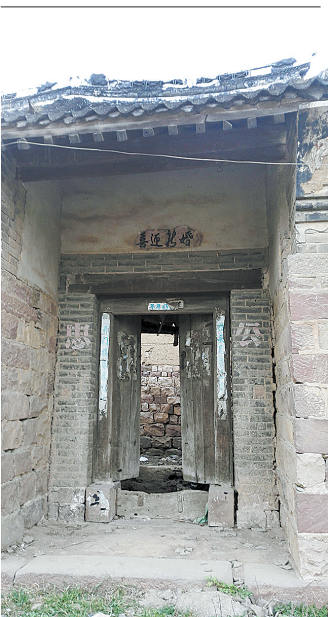
高楼村古民居老门楼