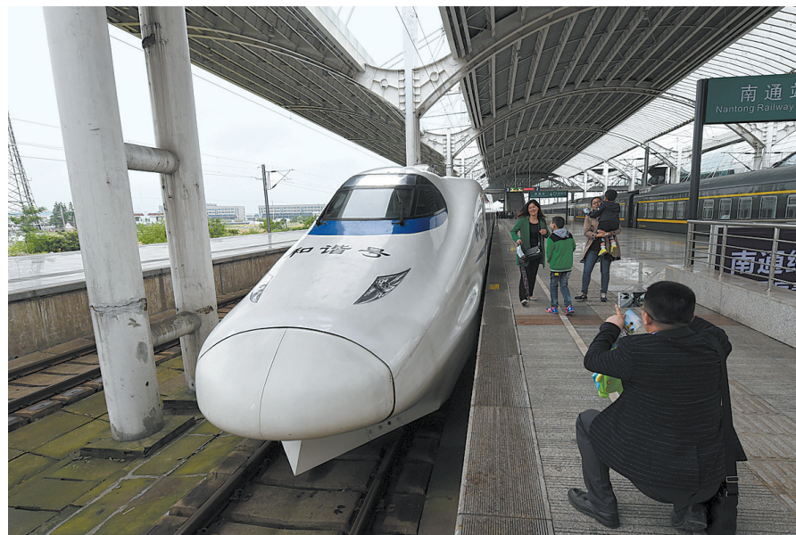
5月15日,乘客在南通火车站拍摄D5518次动车组列车。宁启铁路南京至南通段复线电气化改造工程完工,当日首次开行南通至南京、汉口、重庆北等方向动车组列车13对。

从5月15日零时起,全国铁路开始实行新的列车运行图。本次调图是近十年来最大范围的列车运行图调整,也是铁路运输能力增量最大的一次调整。 从少到多、从早到晚、从近到远……这次大调图将怎么影响你的生活?