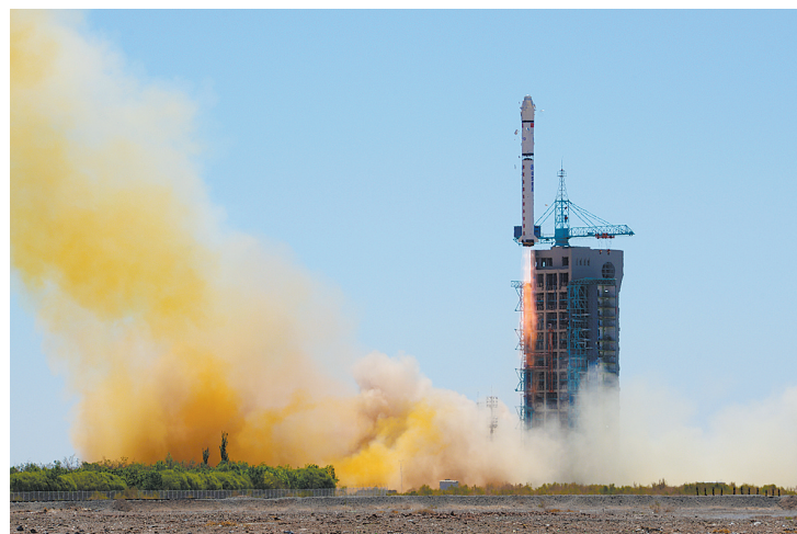
我国成功发射遥感卫星三十号

创今年以来新高 据也门安全部门透露,也门南部哈德拉毛省一警察局附近15日遭到自杀式爆炸袭击,造成至少30人死亡 俄罗斯驻朝鲜清津总领事博奇卡廖夫15日说,朝鲜方面当天释放了日前扣押的俄“埃尔夫”号运动帆船,并表示船只被扣纯属误会 印度高级官员近日表示,印度计划从2017年开始推出十五年发展远景规划,同时废止五年计划安排 印度警方15日说,该国南部特伦甘纳邦14日深夜发生一起严重车祸,造成15人死亡、3人受伤 (均据新华社)