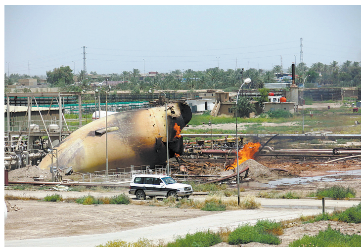
伊拉克首都一天然气厂遇袭致11死13伤

同日,委内瑞拉军方发表声明,强烈斥责外部势力对委内瑞拉军队发起的挑战和蔑视,重申军队坚决维护国家主权完整的决心。 为了应对“国内和国外势力企图推翻委政府的企图”,马杜罗13日晚宣布决定,委内瑞拉再次延长经济紧急状态60天,并在新一轮的经济紧急状态中增加了维护国家主权完整、应对外部威胁的相关内容。 因国际油价下跌和经济陷入困难,委内瑞拉政府自1月14日起进入为期60天的经济紧急状态,并在3月14日将经济紧急状态延长60天。