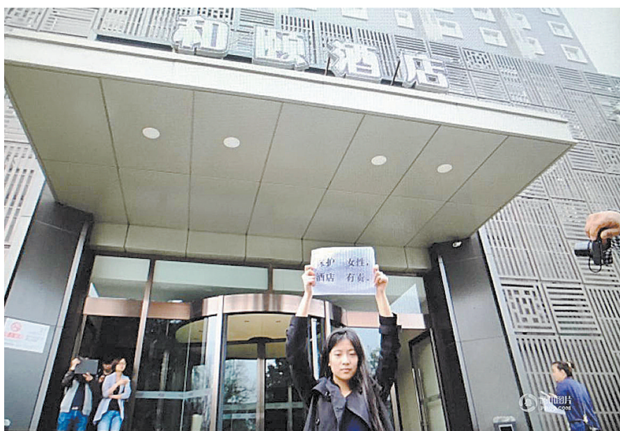
4月6日,几名女性前往涉事酒店,手持“保护女性,酒店有责”“谁对妇女安全负责”“冷漠有毒,酒店、公安有责”等标语,呼吁社会关注妇女权益和安全。