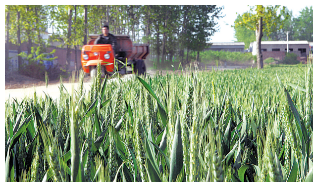
4月13日,一辆农用三轮车从叶县邓李乡孙寨村的麦田旁经过。叶县是我市种粮大县,目前小麦已拔节出穗,长势良好。

网建设改造、智能电网项目、储能项目、光伏扶贫项目、水电站项目、电能替代项目、核电设备研制与服务领域等;二是石油和天然气类项目,包括油气管网主干或支线、城市配气管网和城市储气设施、液化天然气(LNG)接收站、石油和天然气储备设施等;三是煤炭类项目,包括煤层气输气管网、储气库、瓦斯发电等。