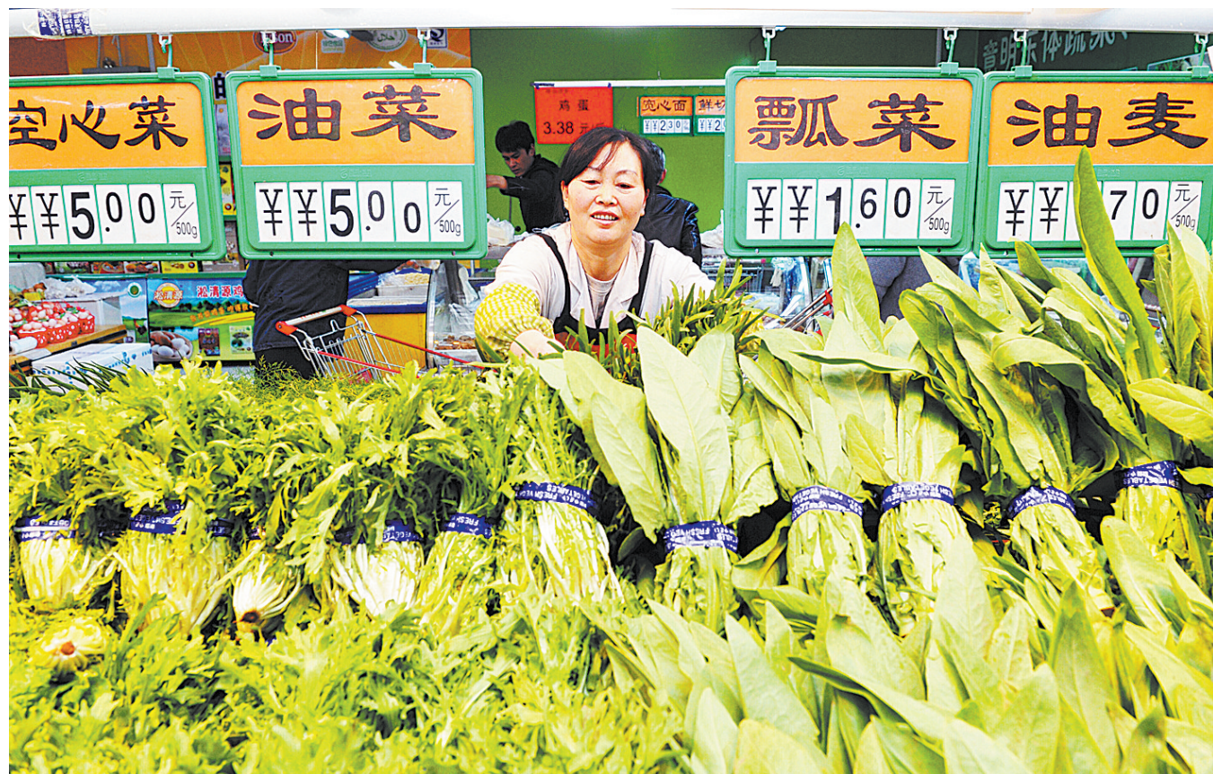
工作人员在河北省沧州市一超市内摆放蔬菜(4月10日报)。