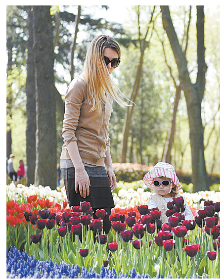
花开四月天 伊城郁金香 4月7日,一名妇女带着孩子在土耳其伊斯坦布尔埃米内公园赏花。 每年4月份是伊斯坦布尔郁金香盛开的时节。在伊斯坦布尔埃米内公园,人们游园赏花,度过美好春光。

新华社东京4月7日电(记者刘秀玲 沈红辉)据日本媒体报道,6日失联的一架日本自卫队军用飞机7日确认坠毁,搜救人员在坠毁现场还发现4名疑似已遇难的自卫队员,4人皆已无呼吸心跳。 当地时间6日下午,日本自卫队一架载有6人的U-125军用飞机在鹿儿岛县鹿屋基地执行任务时,突然从雷达上消失并失联。日本自卫队和当地警方随后在失联地点鹿儿岛县高隈山附近搜索,于7日在山上发现部分损毁机身和4名疑似已遇难的自卫队员,4人已无心跳呼吸。另外两名队员尚未找到。 受大雾影响,搜救工作进展缓慢,搜索将在8日继续进行。