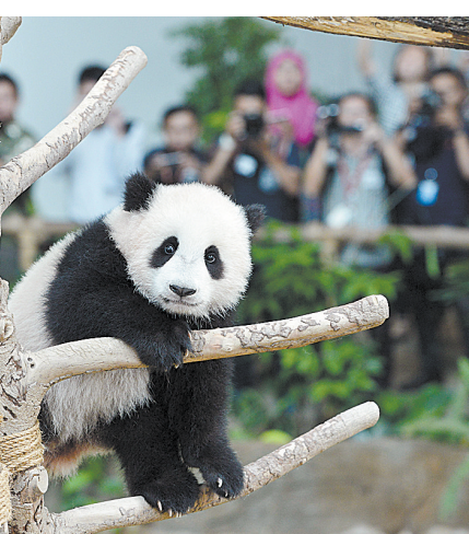
4月7日,在马来西亚吉隆坡,熊猫宝宝“暖暖”在媒体前亮相。

“兴兴”和“靓靓”的到来吸引了大批马来西亚游客,马来西亚国家动物园方面通过“家庭日”“大熊猫志愿者”等一系列活动满足民众近距离接触大熊猫的愿望。“暖暖”的出生则进一步点燃了各界的热情。大熊猫宝宝出生当天,纳吉布总理通过社交媒体亲自向民众公布了这一好消息。 如今,7个月大的“暖暖”已经可以和妈妈共同与游客见面。小家伙在“熊猫馆”内爬上爬下,各种憨态让人忍俊不禁。场地的另一边,熊猫爸爸“兴兴”被抢了风头,默默坐在一边啃着竹子。 旺·朱奈迪说,希望中马关系能够像“暖暖”名字所寓意的那样,继续发展双方之间的友谊。 (据新华社吉隆坡4月7日电)