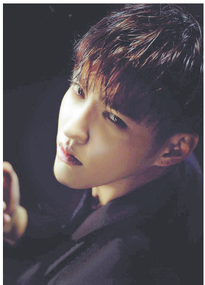
《夏有乔木 雅望天堂》海报

由韩国导演赵真奎执导,籽月编剧,韩庚、吴亦凡主演的青春暖伤爱情电影《夏有乔木 雅望天堂》定档4月29日。该片讲述了一段有关青春与虐恋的纯爱故事。明明可以靠颜值,却选择走心,坚决不放弃追求作品的深度,其独特、更触动人心的故事内核被业内人士赞为“青春电影的全新篇章”。