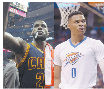
詹姆斯和威少分别当选东西部最佳

记者还了解到,全国第五届中学生艺术展演活动将于4月11日至16日在青岛举行。届时,来自全国633所学校、7000余名中小学师生将相聚青岛。本届全国展演活动还首次邀请香港和澳门特别行政区的学生参加,首次举办全国农村学生艺术实践工作坊。