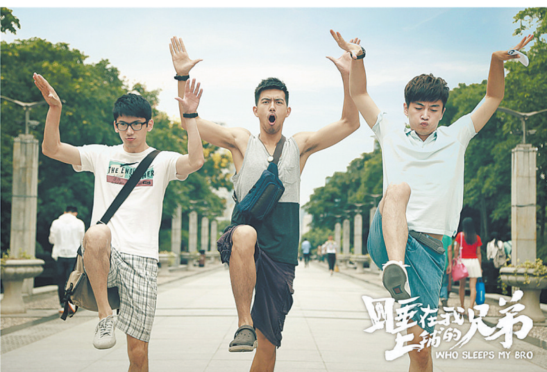
《睡在我上铺的兄弟》海报

过去的三年,青春是中国电影业催生的最热的类型IP之一。《致青春》、《同桌的你》、《匆匆那年》、《小时代》、《栀子花开》……无一不火。今年,由《睡在我上铺的兄弟》打头阵,又会有《谁的青春不迷茫》、《夏有乔木 雅望天堂》、《致青春2》(又名