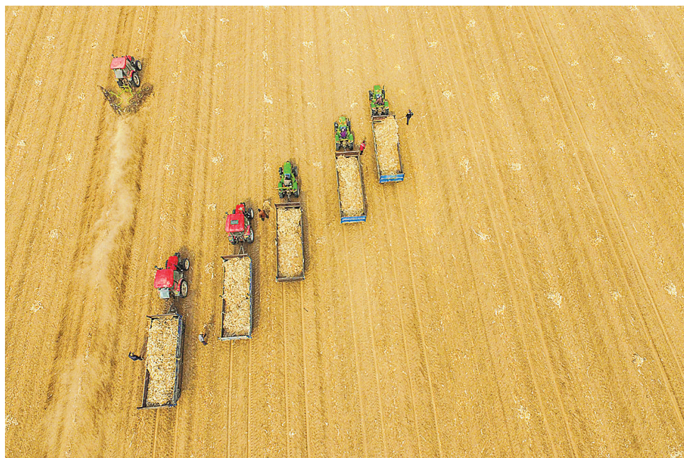
在吉林省洮南高新技术农场,人们在整地春耕(3月21日报)