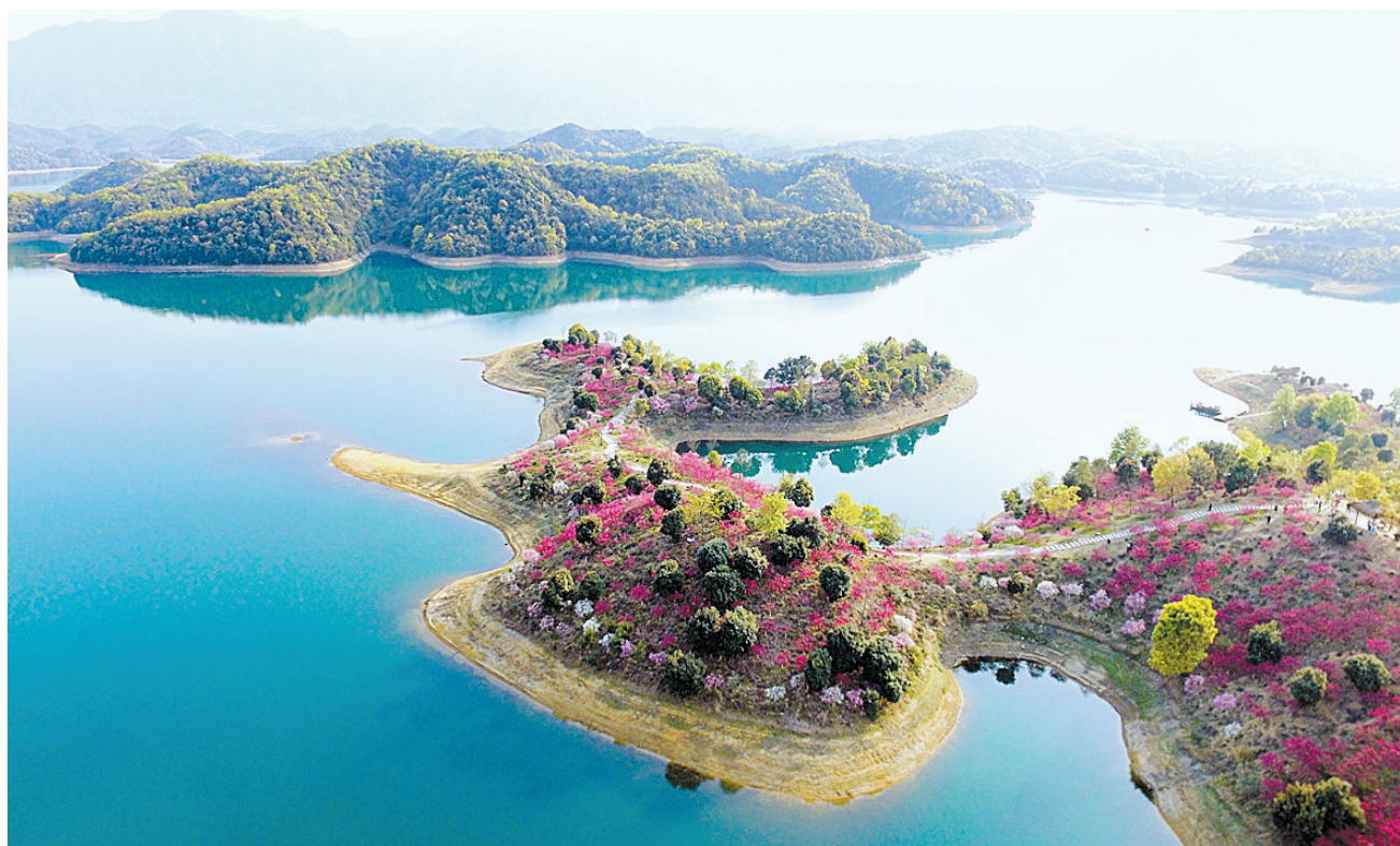
江西省九江市武宁县庐山西海花源谷景区鲜花盛开(3月25日报)