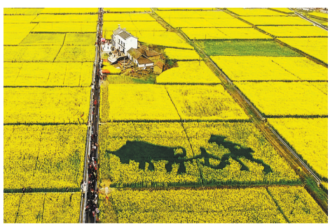
这是3月20日在湖北省宜昌市夷陵区分乡镇航拍的万亩油菜花海