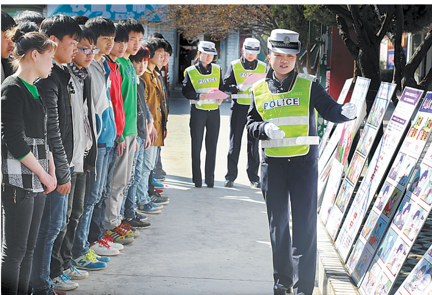
近日,郟县公安局交警大队工作人员借助宣传挂图向同学们介绍路怒症、中国式过马路等不文明交通行为的危害。

笔者认为,预防路怒症,要做到以下几点:一是避免不良情绪干扰。上车前,如果情绪不好,就要学会为自己减压。因为如果开车时脾气火爆或者心情沮