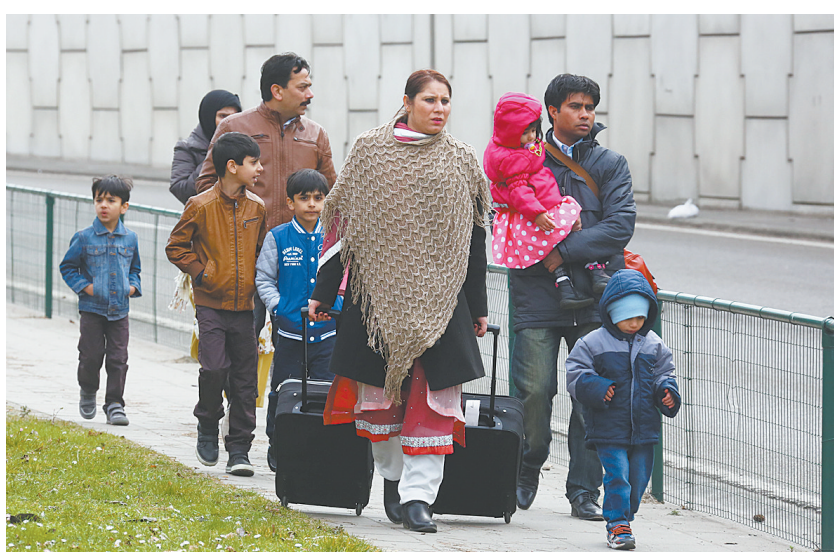
▲3月22日,在比利时首都布鲁塞尔,救援人员和工作人员在发生爆炸的马埃勒贝克地铁站外工作。 ▲3月22日,在比利时首都布鲁塞尔,乘客撤离机场。 新华社发