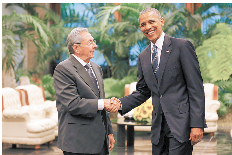
3月21日,在古巴首都哈瓦那,古巴国务委员会主席兼部长会议主席劳尔·卡斯特罗(左)与到访的美国总统奥巴马握手。

据新华社哈瓦那3月21日电(记者毛鹏飞 刘彬)古巴国务委员会主席兼部长会议主席劳尔·卡斯特罗21日在哈瓦那革命宫会见美国总统奥巴马,再次呼吁美国取消对古巴的经济、金融封锁和贸易禁运。 在会见后举行的记者会上,劳尔·卡斯特罗肯定了奥巴马为两国关系正常化所做的努力,表示愿意与美国在抗击寨卡病毒、打击毒品犯罪等领域扩大合作。他说,美国针对古巴长达半个多世纪的封锁依然存在,这是古巴经济社会发展和人民生活改善最主要的障碍。 劳尔·卡斯特罗重申,为实现两国关系正常化,美国必须解除对古巴的经济封锁,归还非法侵占的关塔那摩基地。 奥巴马在记者会上说,他相信美国对古巴的封锁将会结束,但不能预测在什么时候结束。奥巴马表示,两国之间存在不少分歧,但是他相信两国能够展开“建设性的对话”。