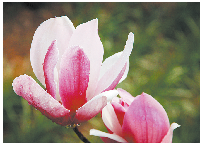
报春 古国凡 摄

不管有棚没棚，喜鹊能搭出这样的窝已经是很智慧的鸟了。它们喜欢群居，往往一棵大树上会有好几个窝。一片林子里，相邻的几棵树上会连着都有窝。喜鹊这样搭窝或是建“楼房”也许是一个家族聚居在一起。喜鹊是温顺的鸟，时常会有杜鹃、斑鸠侵占它的窝，不是有“鸠占鹊巢”这个成语吗？喜鹊有时会不辞劳苦同时在一个地方搭两个窝，这样即使被恶鸟占去一个，自己还有一个，真是一种宽容有胸怀的鸟啊。花喜鹊还是一个有责任心不花心的鸟，你看它们总是出双入对，不弃不离。