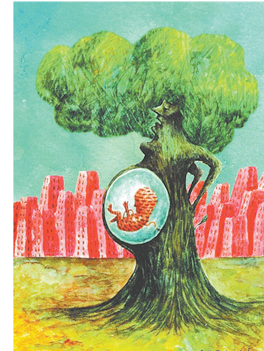
孕育新生 图西奥斯(西班牙)作

我认识一位同行,他也给学生提供低价的督导,但这部分收入他都捐给慈善基金。他解释这件事时说,只有捐了心里才会舒服。我有点理解他是怎么想的,而且打算学他这么做。从赚钱的角度来讲,当然是赚得越多越好,但那是出卖时间、换取收入的市场行为。有时候我们也要不赚钱,唯有如此,我们才是拥有自由意志、掌握自己生活的人类,而不仅仅是一个被定价的商品。