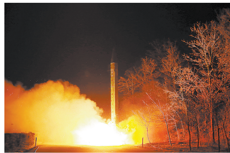
金正恩已下令将所有核打击手段处于随时准备发射状态 这张朝中社3月11日提供的照片显示的是朝鲜人民军战略部队弹道火箭发射训练现场。 据朝中社11日报道,朝鲜最高领导人金正恩日前已下令朝鲜人民军战略部队将所有核打击手段处于随时准备发射状态。

●外交部发言人洪磊11日在例行记者会上表示,美国和其他少数国家借口人权问题公开指责中国,严重干涉中国内政和司法主权,中方坚决反对,绝不接受 ●中国消费者协会11日发布的《2016年春运铁路客运服务体验式调查报告》显示,2016年春运铁路客运消费者总体满意度得分为75.9(满分为100分) ●缅甸联邦议会人民院和民族院11日分别选举全国民主联盟(民盟)资深成员吴廷觉和民盟钦族议员亨利班提育为副总统,军人议员团也在当天晚些时候宣布推举现任仰光省长吴敏瑞为副总统。按照缅甸宪法,联邦议会将从三人中选出一名总统 ●美国国防部10日证实,美军在今年2月抓获一名极端组织“伊斯兰国”的重要化学武器专家 ●巴西前总统卢拉涉嫌洗钱、隐匿资产被圣保罗州检察院起诉 (均据新华社)