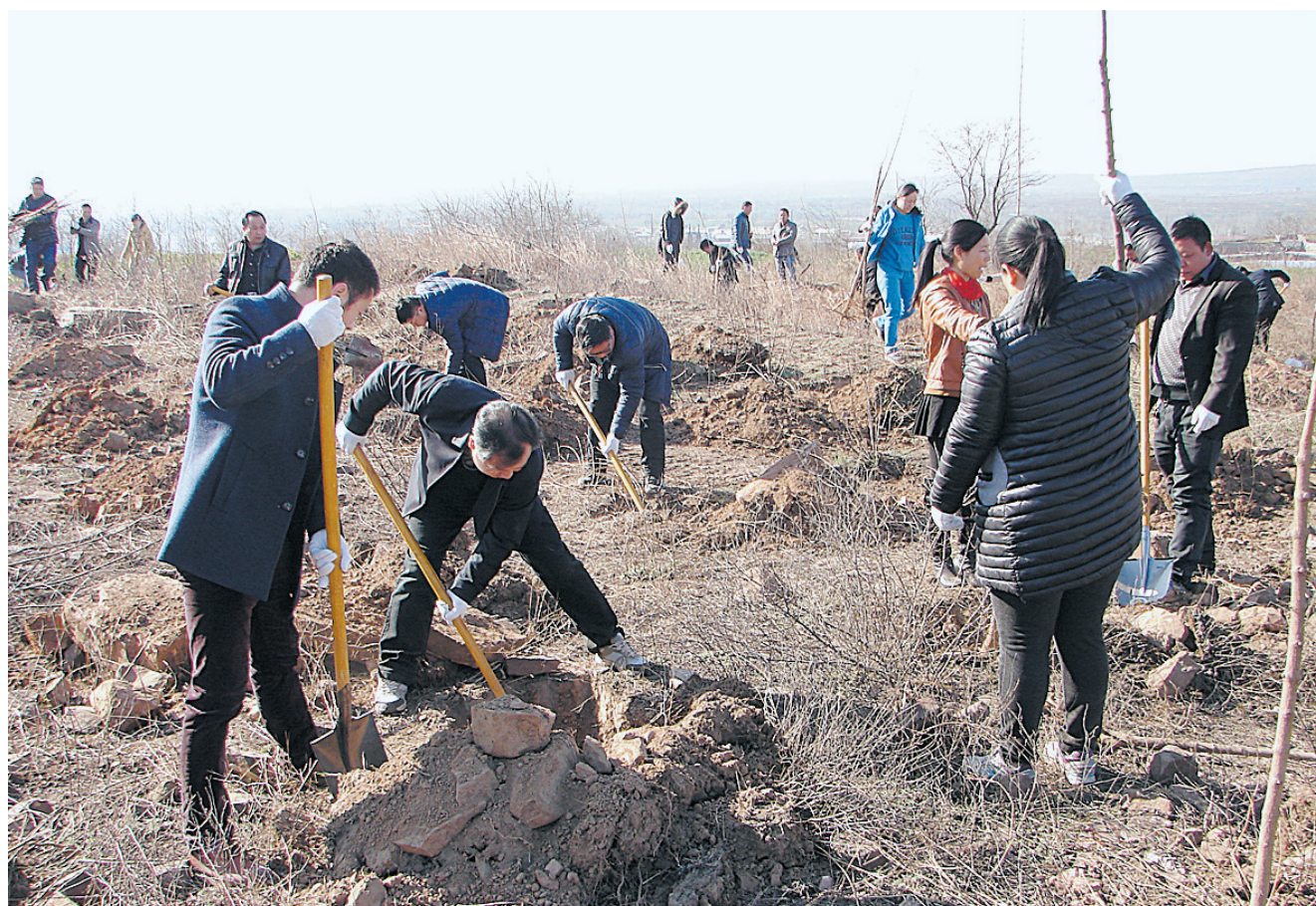
3月11日上午,郟县安良镇组织80余名机关干部,来到曹沟革命老区开展植树造林活动。