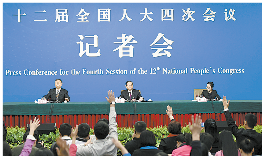
3月10日,十二届全国人大四次会议新闻中心举行记者会,邀请教育部部长袁贵仁就“教育改革与发展”的相关问题回答中外记者的提问。

10日下午,教育部部长袁贵仁在十二届全国人大四次会议记者会上就“教育改革与发展”相关问题回答了中外记者提问。