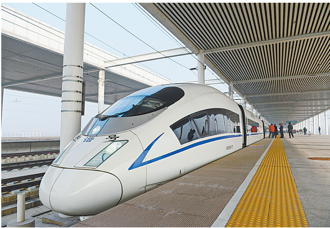
津保铁路正式开通

湛河区的四大班子成员及扶贫办主任,新城区、高新区的领导班子成员及扶贫办主任在平顶山分会场参加会议。各县(市)和新华区、石龙区分别设立分会场,组织收听收看。