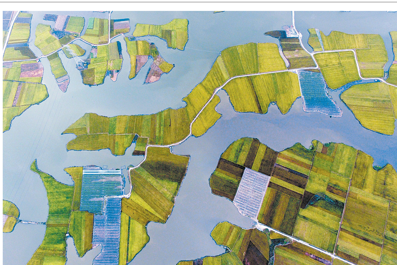
10月19日航拍的浙江省温岭市坞根镇湿地。

我国暗物质粒子探测卫星“悟空”具有先进的科学探测指标,是迄今为止观测能段范围最宽、能量分辨率最优的暗物质粒子探测器,超过国际上所有同类探测器。在三年的设计寿命中,暗物质卫星将通过高空间分辨率、宽能谱段观测高能电子和伽马射线寻找和研究暗物质粒子。