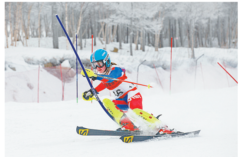
国际雪联远东杯赛开赛

本次比赛由体育局主办,来自冠军、宏鹰、群星、奥星、雏鹰等乒乓球俱乐部和郑县、宝丰县的106名青少年选手参加了比赛。