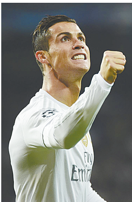
12月9日,C罗进球后庆祝。

如果说C罗的纪录令人惊喜,那么罗马队在本赛季所创下的一系列纪录则有些尴尬。在最后一场比赛中,罗马队在主场与鲍里索夫互交白卷,以积6分净胜球为负5的成绩出线,拉低了此前由泽尼特保持的积6分净胜球为负4的最差出线成绩。此外罗马队也成为首支小组赛丢16球却依然可以晋级的球队。