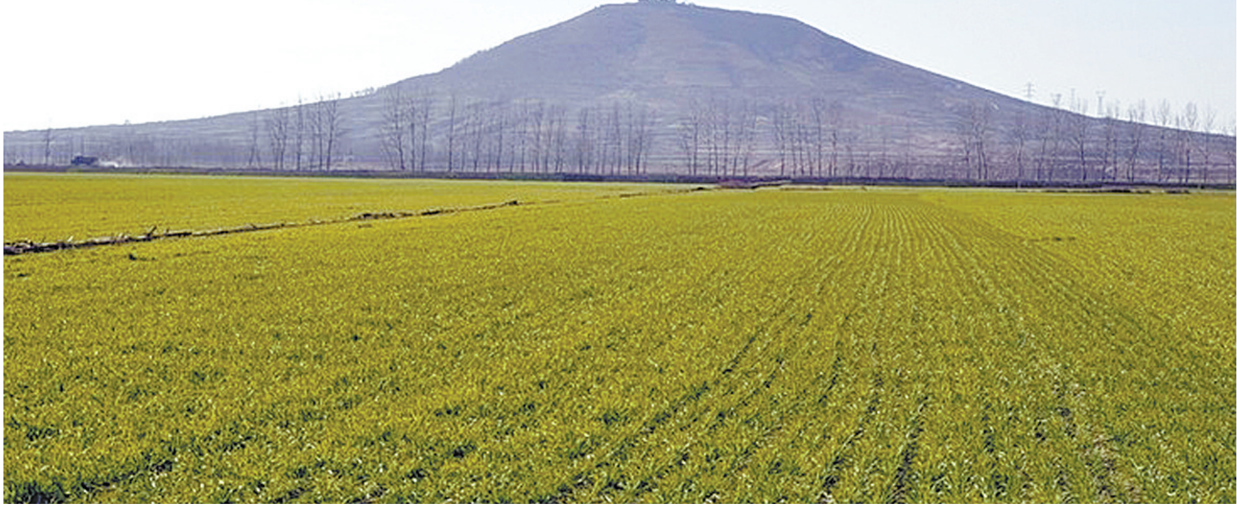
露峰山，也叫鲁山坡，此山于大片平原中突然耸立，巍峨壮观。

“八百里伏牛山逶迤西来，在古老的鲁阳澧水北岸画了一个浑圆的句号，这个句号就是被誉为鲁山古八景之首的露峰山。露峰山背靠伟岸的伏牛山，面向肥沃的黄淮大平原，进可攻，退可守，战略地位十分重要。”