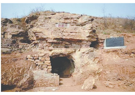
在露峰山山腰处，有一洞穴，叫牛郎洞。在传说中，牛郎被妻子赶出家门后就在此处居住，并有机会见到织女。

钧天在上，君子当有钧天之享。对应的地，则是钧地；钧地突起，可与钧天相近，达到天人感应，钧地突起名为钧台，从政治文化上讲，东钧台，乃是钧天之台，中国之中心——中央所在地；从地域文化讲，西钧台，乃是钧天之地，堪舆之合，中