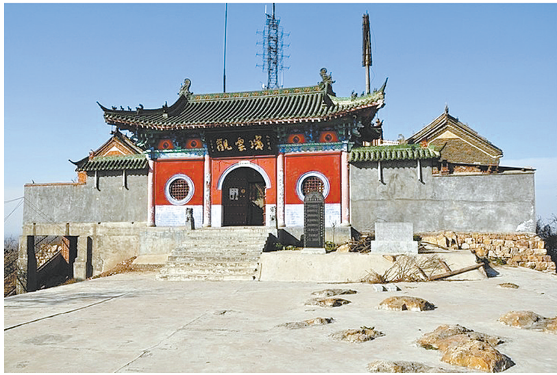
露峰山顶的瑞云观