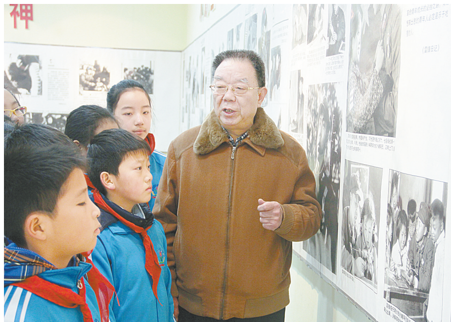
关心下一代健康成长

这是今年9月《郑县科级领导干部党纪党规考试办法》出台后的首场考试。通过随机抽取,龙山街道、白庙乡、郑县交通运输局等单位的460余名科级干部参加了当天的考试。 按照该办法规定,郑县每年将组织1至2次党纪党规考试,每次随机抽取全县1/2以上的科级领导干部参加考试。考前,县纪委委托第三方独立机构出题,同时明确内容、范围和题目类型;考试中,严格执行闭卷、保密、监考、巡考制度,防止泄题舞弊;考试结束后,组织人员统一阅卷,成绩公示。第一次考试不及格者随下次考试补考,补考不及格者全县点名通报并再次补考,第二次补考不及格者将给予党纪处分和组织处理。 (卢拥军 高轶鸥)