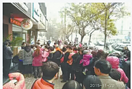
昨天 匿名网友朋友圈截图

才知道只有12岁以下的儿童生日当天可以领。这是我第一次转发,结果空欢喜一场。以后我肯定不会再参与了。