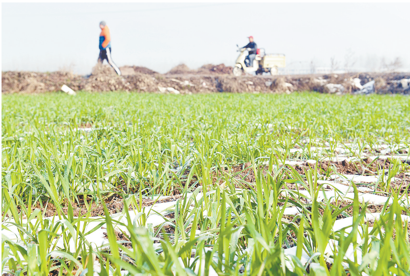
11月26日上午，叶县任店镇前营村村头麦田积雪未融。近日，我市出现降雪天气，据气象部门工作人员介绍，这场雪对小麦生长非常有利。