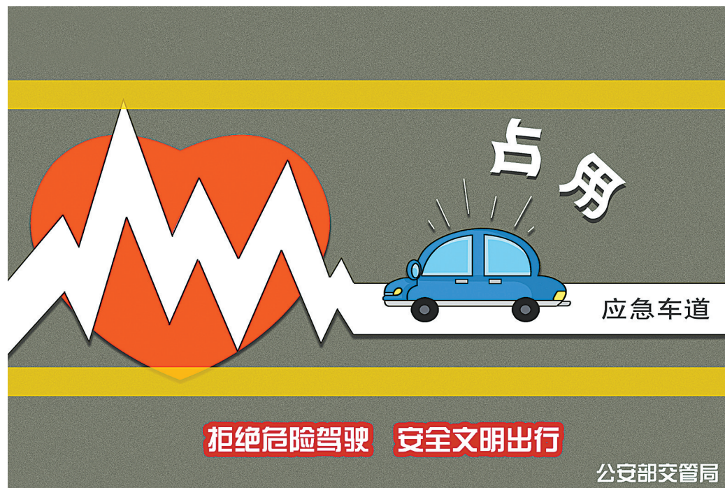
拒绝危险驾驶 安全文明出行

能力和机械操作控制力下降，容易发生交通事故；三是驾驶员饮酒后身心易疲劳，思想倦怠，如果较长时间持续驾车，必然会造成交通事故。据统计，驾驶员酒后驾车比没有饮酒情况下发生交通事故的概率高达16倍，具有严重的社会危害性。据有关部门统计，我国每年由于醉酒驾车引发的恶性交通事故多达数万起，给人民生命财产安全带来了极大的危害。