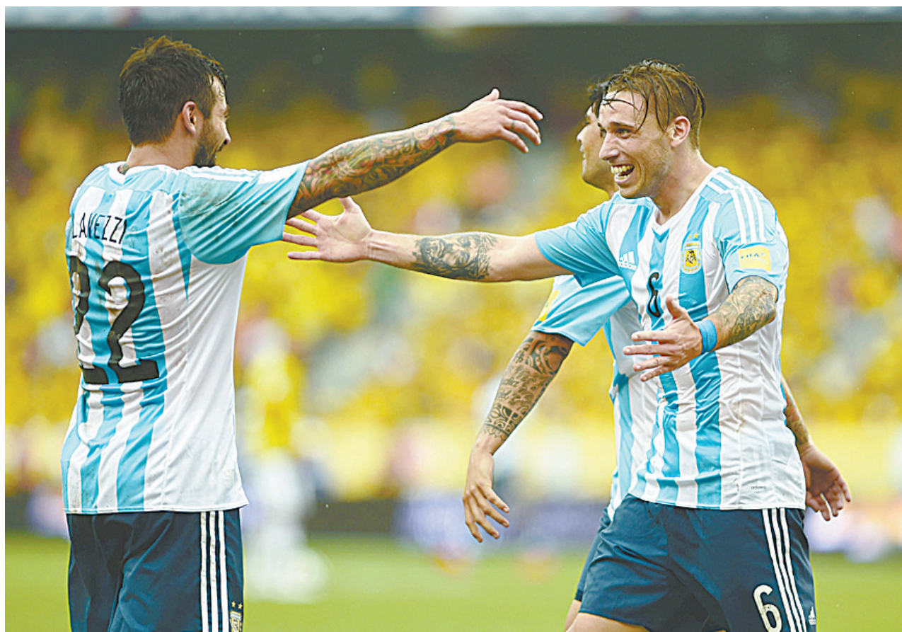
11月17日，阿根廷队球员比利亚（右）进球后与队友拉维奇庆祝。当日，在哥伦比亚巴兰基亚进行的2018年世界杯足球赛南美区预选赛中，阿根廷队客场以1：0战胜哥伦比亚队。