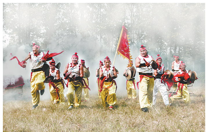
郑县大铜器舞表演

我爷爷在世时爱喝酒。夏日，常常手提酒壶，拿把大扇子，坐在绿荫下谈笑风生。有时还爱哼个越调小曲，有时双掌相击，低吟着大铜器的曲牌。酒劲一上来，他就把村里爱打大铜器的人找来，在树荫下拉开了“战场”。村里如有重大活动，更是少不了他。若要去神皇镇或去安良镇比赛大铜器，他让家中的男男女女不分忙闲全都去。曾有一次他牵着一头驴（当时是家中唯一的贵重财产），去白庙的下叶村收“清灰”（旧时做瓷器的釉料，草