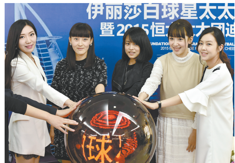
恒大球星太太团俱乐部成立

总奖金高达215万美元的该赛事是WTA为珠海量身定制的一项全新赛事,由世界单打排名9-19位的选手和双打排名9-12位的选手参加。作为整个女子网坛的年度收官之作,冠军将在8日决出。