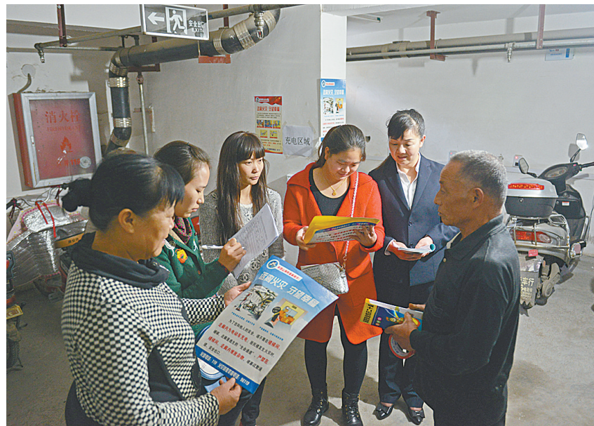
10月27日,在湛河区马庄街道南社区一小区车棚内,社区工作人员在充电区域为居民讲解电动自行车充电时的注意事项。

10月20日,我市召开电动自行车火灾防范专项治理工作会议,会议就全力整治我市电动自行车违规停放、违规充电、非法改装等乱象进行部署。