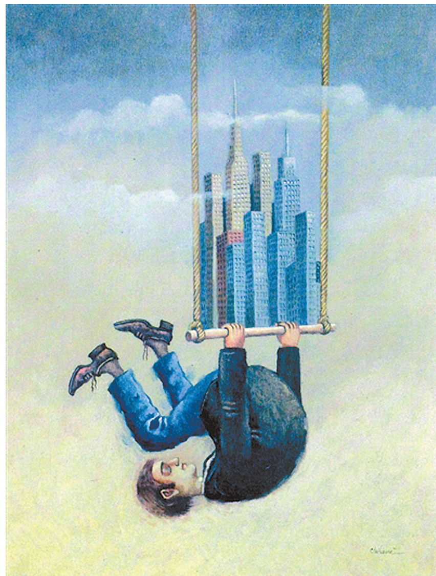
都市梦想 克里哈纳(罗马尼亚)作

就在S先生在等待和奔波中已经变得累觉不爱时，总算有一家靠谱的公司给了职位，S先生也立即不再挑剔，收拾收拾赶紧上班去了，给自己的裸辞生活画上了一个句号。现在S先生又过上了每日忙碌期盼假期的生活，一切仿佛转了一个圈又回到了原点。S先生却也不再抱怨，虽然还是希望命运能在未来的某个时刻发生转折，但是S先生真的再也不想裸辞了。