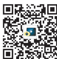
平顶山微视二维码