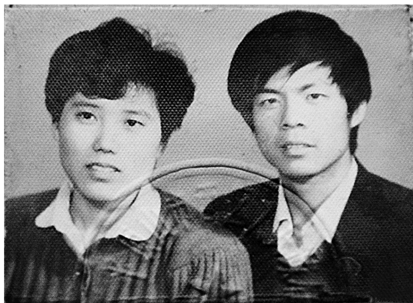
我们的结婚照。

网友“果红翟”：我和妻子是1991年元旦结婚的。那时候，爱一个人很简单，不过是遇见了，喜欢了，愿意与对方过日子；希望她生个宝宝，喜滋滋地带给亲友看。刚刚上班，手头紧张，别说婚纱照，就是彩色照片也很昂贵。我们的结婚照是在宝丰县城照的黑白照。我穿的是蓝色西装，妻子是烫发，这都是当时流行的。以后的日子里，我们共同担当，从没有房子，到现在吃住不愁，我们就是互相依靠，奋力向前，共同应对生活中的次次考验。