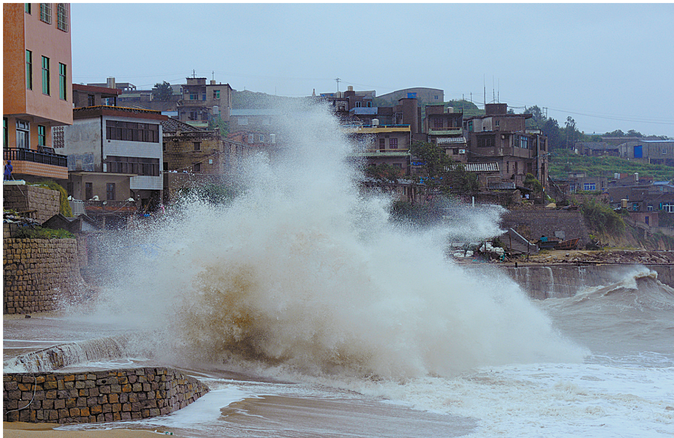
台风“杜鹃”登陆福建

《意见》提出七个方面的政策措施。一是推进简政放权，调整完善市场准入资质，推进一照多址等住所登记制度改革。二是创新管理服务，建立与电子商务发展需要相适应的管理体制和服务机制，开展商务大数据建设和应用。三是加大财税支持力度，促进电子商务进农村，积极推广网上办税服务和电子发票应用。四是加大金融支持力度，支持不同发展阶段和特点的线上线下互动企业上市融资，发展第三方支付、股权众筹等互联网金融。五是规范市场秩序，创建公平竞争的创业创新环境和规范诚信的市场环境。六是加强人才培养，建设电子商务人才继续教育基地，开展实用型电子商务人才培养。七是培育行业组织，建立良性商业规则，促进行业自律发展。