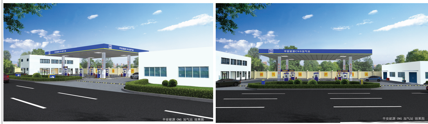
平安能源 CNG 加气站 效果图