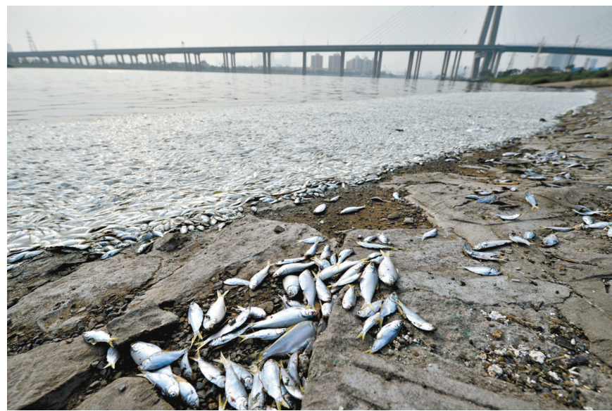
这是海河东沽防冲闸附近的死鱼(8月20日摄)。

环保部专家称事故核心区环境污染的总体状况可控 天津海河大闸附近出现大批死鱼河段未检出氰化物