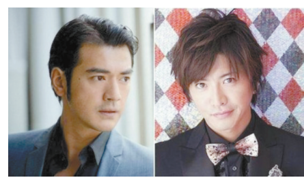
金城武与木村拓哉(资料图片)

据悉，侯孝贤从筹备到开拍花去7年时间，编剧团队朱天文、阿城跟随侯孝贤做了大量田野调查，查阅了大量古籍，仅剧本朱天文就曾八易其稿。