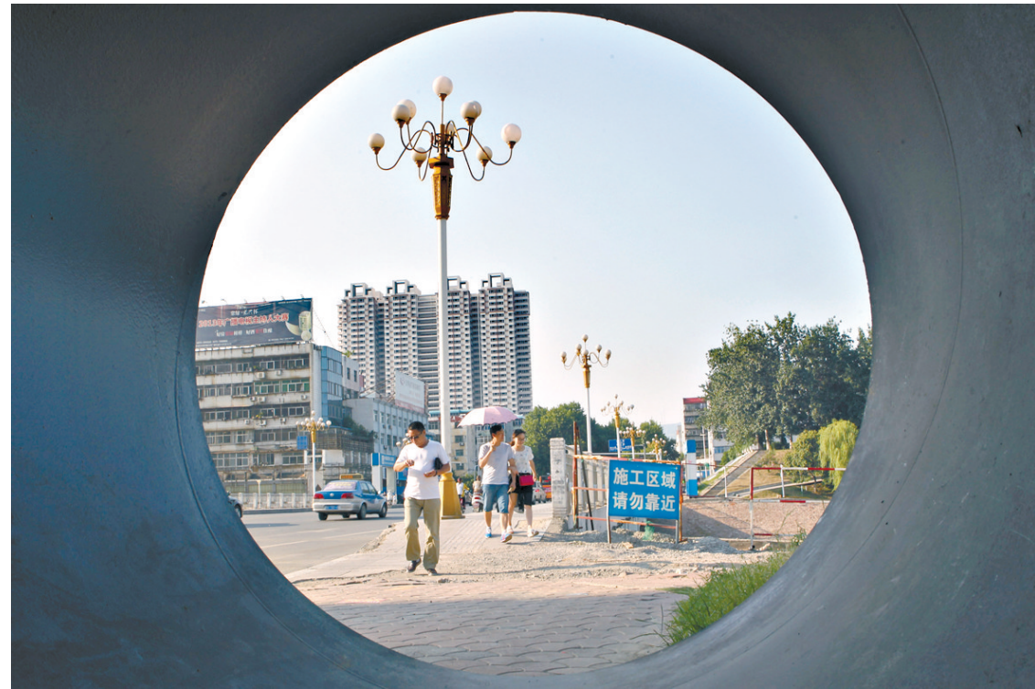
8月10日,记者从排污钢管中看到市区光明路淇河桥景色。淇河治理淇南顶管工程,自市区凌云路至光明路淇河桥,全长5902米,直径达2.4米的钢管,可保证城市未来发展需要。排污管采用

郑理通报了全市近期大气污染防治工作情况,并对做好下一步工作进行具体安排。宝丰县、新华区、市住建局、市交通运输局分别在会上作表态发言。