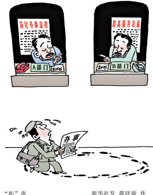
“拒”离 蒋跃新作

穿鞋要合脚,施政也当利民惠民。既然像老年证这种,如派出所同志所说的“除了持证的本人其他人拿着也没有用”,那么,众多仍在给群众带来麻烦的办证陈规旧制,还要在群众的“吐槽”声中延续多久?