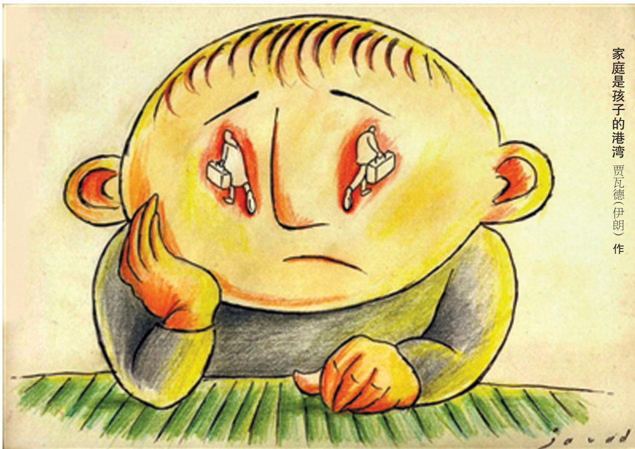
家庭是孩子的港湾 贾瓦德(伊朗)作

●以前上学时，老被一差生欺负，终于有一天，小宇宙爆发了，指着他大吼道：“你等着，将来我一定找你算账。”十年后，誓言实现了，他成了我的老板，我成了他的会计。（笑/辑）