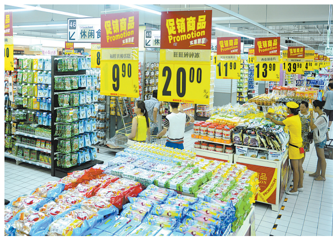
商品流通市场繁荣活跃