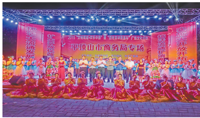
2015“文明鹰城·欢乐中原”暨“百姓宣讲直通车”市商务局专场文化活动