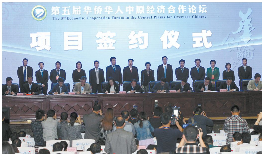
第五届“华合论坛”项目签约仪式