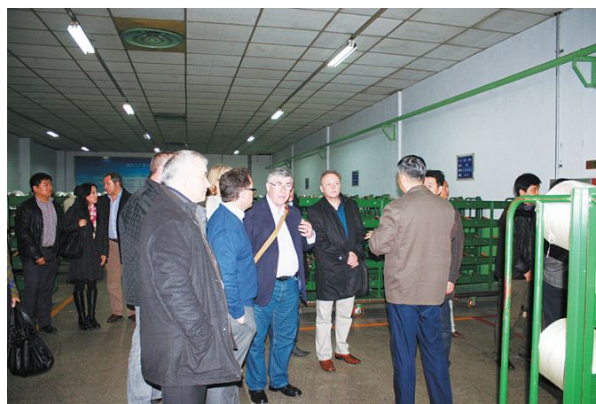
英国客商考察马博列麦气袋丝制造公司出口产品