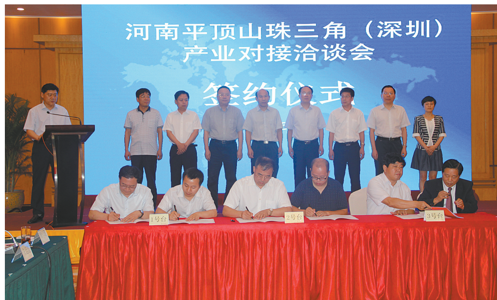
2015年珠三角(深圳)平顶山行情推介及产业推介洽谈会成功举办

近年来,面对错综复杂的国内外经济形势和发展的多种挑战,市商务局始终坚持以经济建设为中心,坚定不移地实施“开放带动”战略,坚持扩大开放与扩大消费并举,稳中求进、改革创新,持续打造“开放商务、活力商务、民生商务、创新商务、和谐商务”,取得了明显成效。我市的外向型经济和商品市场步入了一个新的发展时期,“实施大开放,开拓大市场,搞活大流通,发展大商务”的商务工作新格局已初步形成。近三年来,市商务局先后荣获“省级文明单位”、“招商引资工作先进单位”、“招商引资项目落实年活动先进单位”、“商务工作先进单位”、“商务系统政风行风建设工作先进单位”、“生猪屠宰行业管理工作先进单位”、“家电下乡工作先进单位”、“市场体系建设工作先进单位”、“市场运行监测工作先进单位”、“单用途商业预付卡管理工作先进单位”、“全市“责任目标先进单位”、“督查工作先进集体”、“企业大服务专项行动先进单位”、“消防工作先进单位”、“应急管理先进单位”、“政务信息工作先进单位”等荣誉称号。