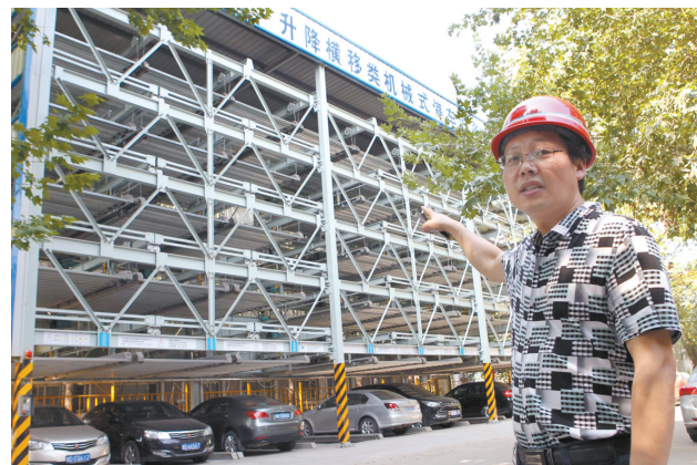
7月29日,技术人员在介绍研发立体停车库情况。随着城市机动车辆不断增加,停车难问题日渐显现。平煤神马集团机械制造公司瞄准这个商机,于今年初立项,本月15日研制出PSHS六层升降梯类机械式立体车库,最快3分钟便能将一辆轿车停靠在泊位上,共能停44辆车。

快金融改革、深化科技体制改革、构建开放型经济新体制情况;加快重点项目建设,扩大有效产能,强化集群培育,培育新业态新模式新产业,推动服务业加快发展情况;加强产销对接、银企对接和企业用工对接,清理整顿涉企收费,加大对困难行业帮扶力度,支持骨干企业兼并重组情况等。 《实施方案》在对各项任务明确具体牵头单位和责任单位的同时,还要求,各级、各部门要根据方案明确的主要任务进行排查、摸底调研,并认真梳理存在的突出问题和潜在风险,拉出问题清单,建立整改台账,落实整改措施,于8月底前对照整改台账,边整改边自查,确保整改问题不缺不漏,推动整改工作取得实效。