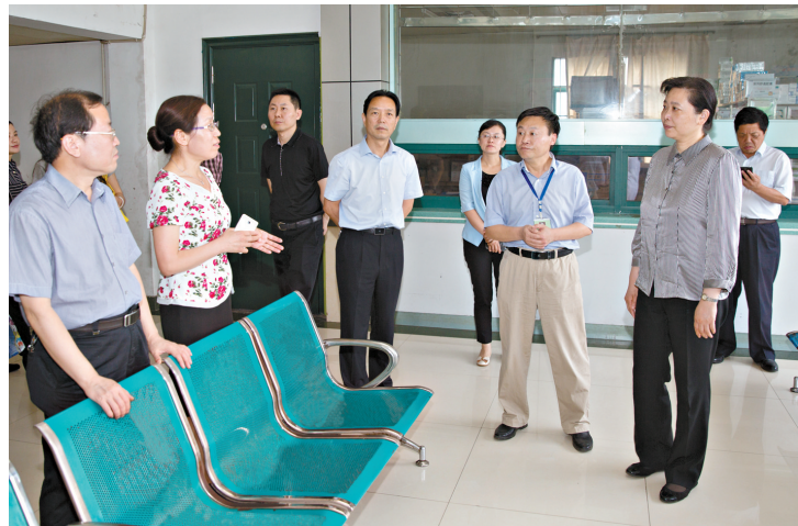
副省长王艳玲(前右一)到郟县人民医院调研医改工作