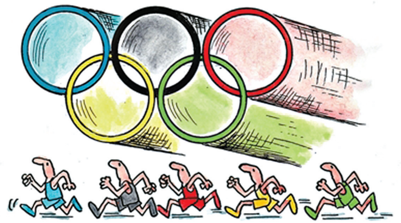
战争与和平 巫德华作