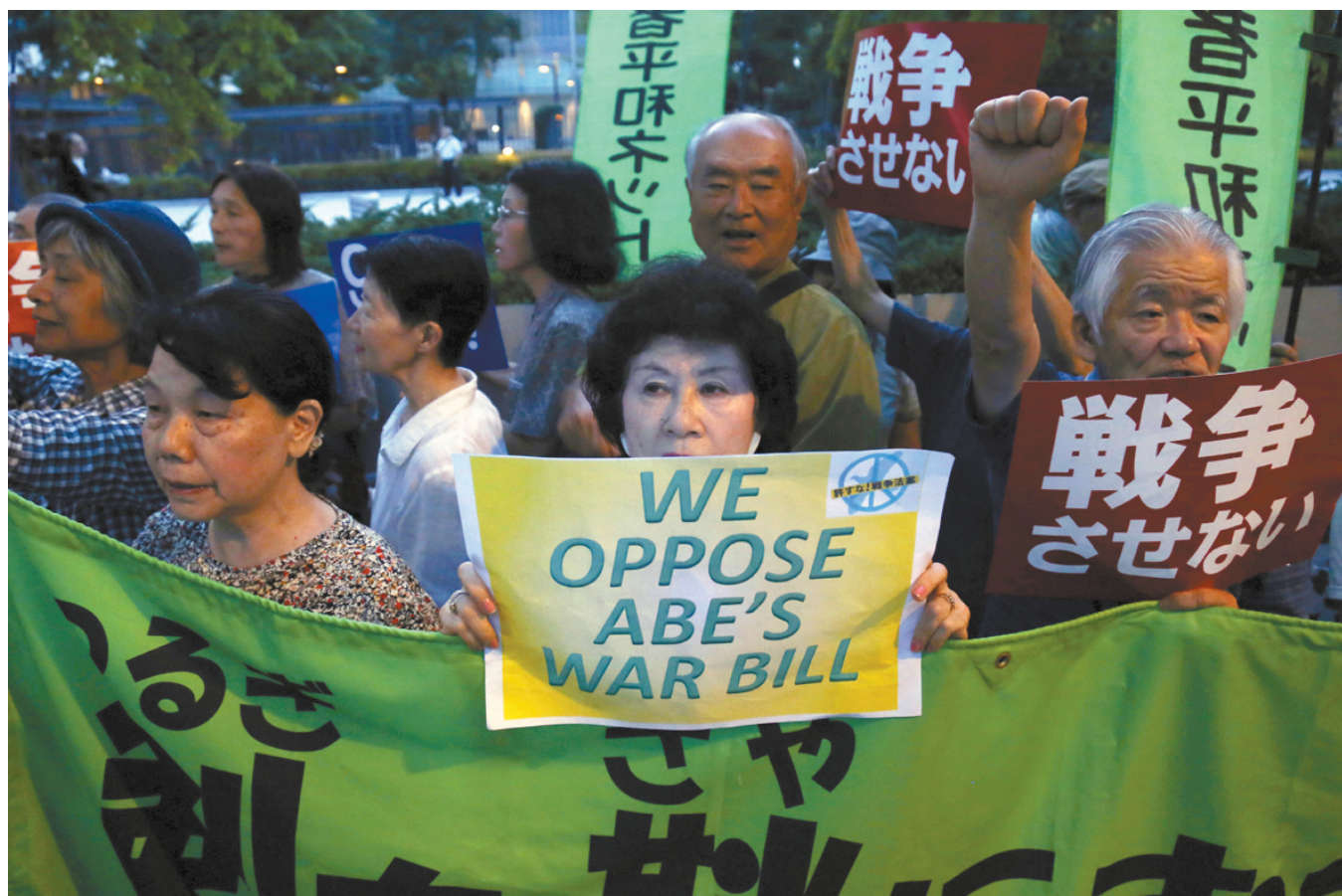
7月23日,在日本东京国会附近,人们手举标语抗议新安保法案。

“中日邦交正常化以后,日本的民间进步力量在两国关系的发展中发挥了重要作用,民间层面的理解和认同对中日世代友好非常重要。”高洪说,中国一直将日本当局右倾化的言行同广大日本人民区分开来。