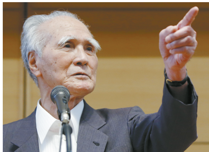
7月23日,在日本东京,日本前首相村山富市发表演讲反对新安保法案。