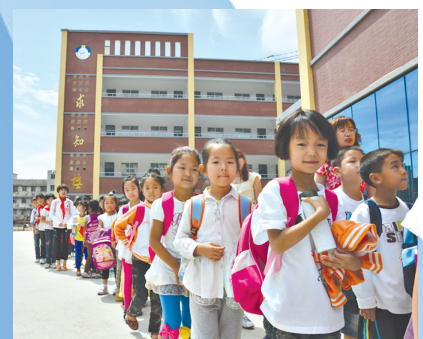
办学条件不断改善