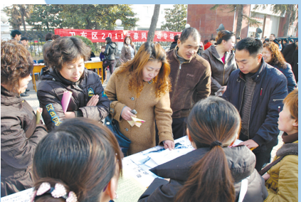
举办招聘会促进就业

努力不止,脚印在延伸。2015年,是全面深化改革的关键之年、全面推进依法治国的开局之年、全面完成“十二五”规划的最后一年。33万卫东人坚定信心,积极作为,在迎接挑战中攻坚克难,在抢抓机遇中加快发展,正在以勤勉奋进的姿态努力在新常态下开创经济社会发展新局面,绘就幸福画卷,谱写美丽卫东新篇章。