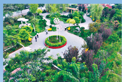
建设游园改善群众生活环境