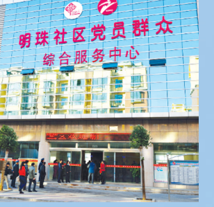
党群综合服务中心

持续推动开放招商工作。 今年,卫东区招商引资工作重点是落实市定的招商工作“大员上前线”的要求,按照“承接抱团转移、加速集群发展”的思路,强化组织领导,优化招商环境,专门成立招商工作领导小组并多次由区主要领导带队积极参加招商活动,持续推动开放招商工作。上半年,该区实际利用省外资金20.8亿元,占市定目标21.5亿元的96.7%;实际利用市外资金23.4亿元;新引进省外资金项目27个,其中亿元以上项目7个,合同利用省外资金37.6亿元;新引进重大项目1个,为总投资17亿元的平棉东桂苑项目;共新签约亿元以上项目7个,开工1个。