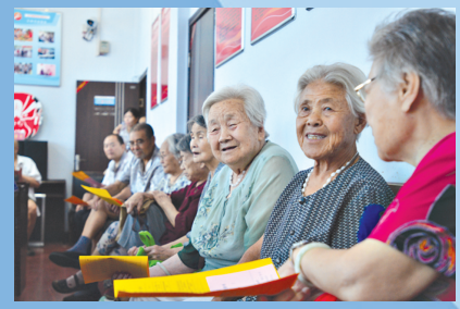
为辖区老年人发放高龄补贴