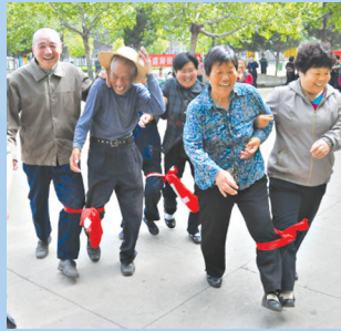
和谐社区其乐融融

上半年,卫东区23个第一批市重点项目完成投资28.77亿元,固定资产投资完成39.6亿元。