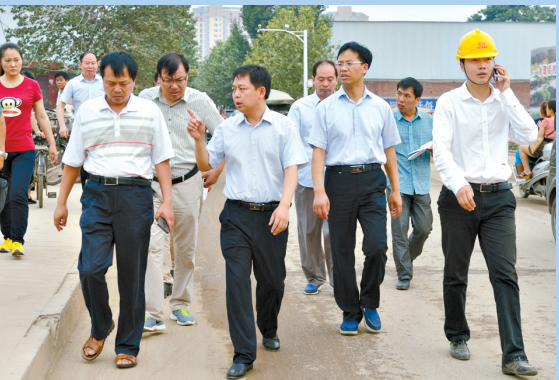
区长耿勇军(右五)调研湛河治理工作