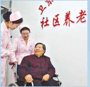
社区养老医养结合