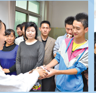
积极为劳动者维权