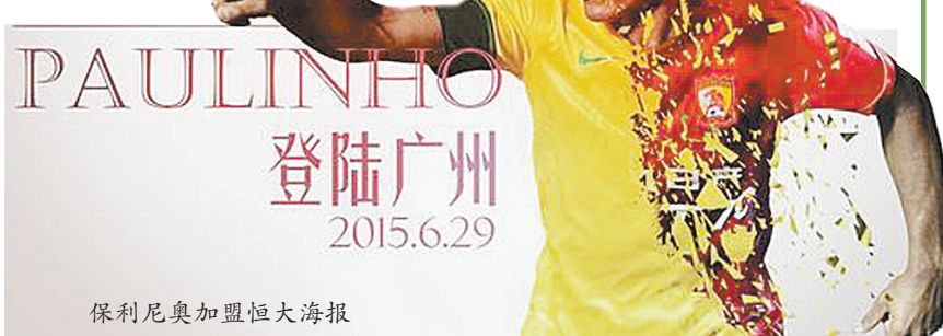
保利尼奥加盟恒大海报