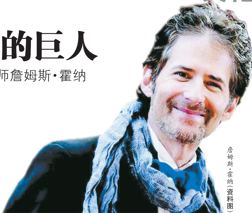
詹姆斯·霍纳(资料图)

然而,霍纳并未因此而站在世界的聚光灯下。从《燃情岁月》《勇敢的心》到《泰坦尼克号》《阿凡达》,再到与中国结缘的《功夫梦》《狼图腾》,霍纳配乐的电影往往受到全世界的瞩目,不过霍纳比起他的同行约翰·威廉姆斯、汉斯·季默乃至久石让,显得过于低调,往往被电影的名气和光环所掩盖。他也并非是一名完美的音乐家,常被批评缺乏创造力,被