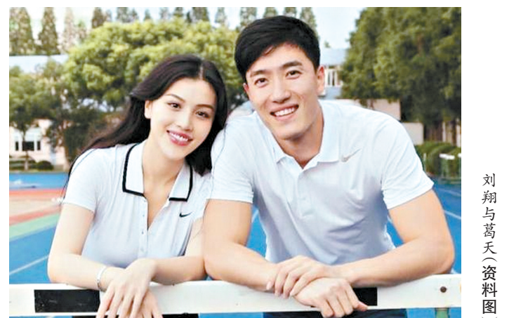
刘翔与葛天(资料图)

刘翔与葛天于2014年9月8日在上海普陀区民政局登记结婚。葛天2012年毕业于中央戏剧学院,曾表示是刘翔的粉丝,两人于2009年的一次朋友聚会上相识。刘翔是中国田径的标志性人物,曾夺得雅典奥运会男子110米栏冠军,并打破该项目的世界纪录。