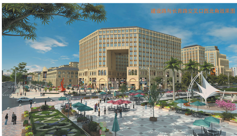
建设路与长青路交叉口西北角效果图