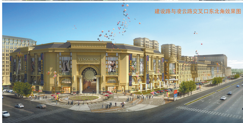
建设路与凌云路交叉口东北角效果图