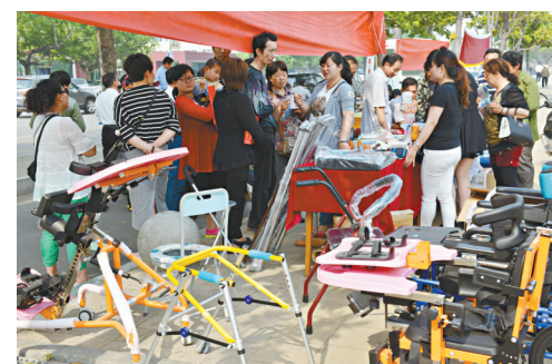
市残疾人辅助器具服务中心工作人员在为残疾人讲解各种辅助器具的使用方法。