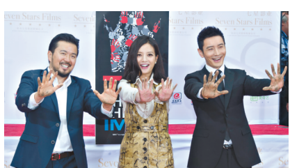
林诣彬、赵薇、黄晓明好莱坞留印

6月3日,导演林诣彬和演员赵薇、黄晓明(从左至右)在洛杉矶好莱坞TCL中国剧院门口留下手印。