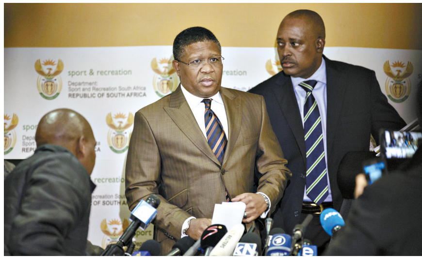
6月3日,南非体育和娱乐部长菲基利·姆巴鲁拉出席新闻发布会。

本报讯 南非体育和娱乐部长菲基利·姆巴鲁拉6月3日在约翰内斯堡举行新闻发布会,承认曾在2010年世界杯申办过程中向国际足联支付1000万美元,但他再次否认了关于行贿的指控。