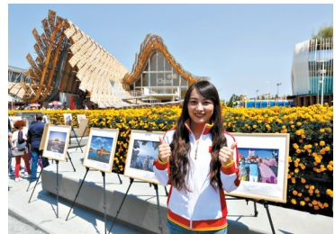
申冬奥大使亮相米兰世博会北京周

6月3日,北京申办2022年冬季奥运会形象大使李妮妮亮相米兰世博会北京周闭幕式,为即将在瑞士洛桑举办的中冬奥城市陈述交流会聚拢人气、增添动力。